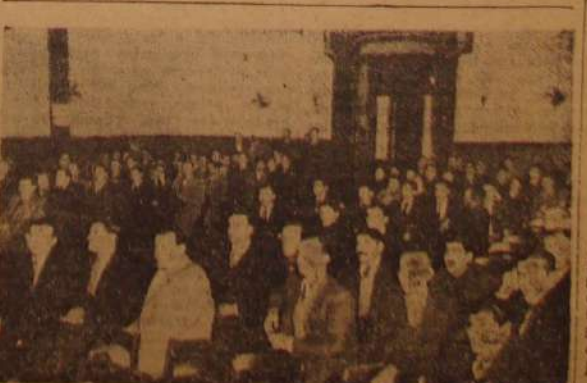
Asamblea de la rama Cotton y Medias realizada en el salón "Worwaerta"

Esto evidencia que la Unión Industrial Argentina y los industriales de la