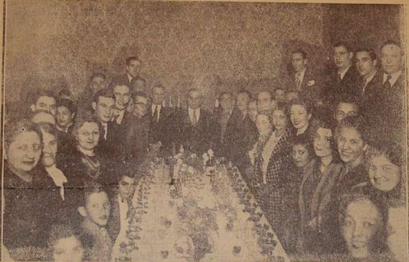
Cabecera del lunch en homenaje a la C. D. saliente

Reproducimos a propósito la nota enviada por el sindicato, al Departamento de Trabajo de la