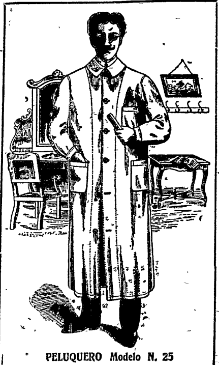
PELUQUERO Modelo N. 25

ENVIOS a cualquier punto de la República