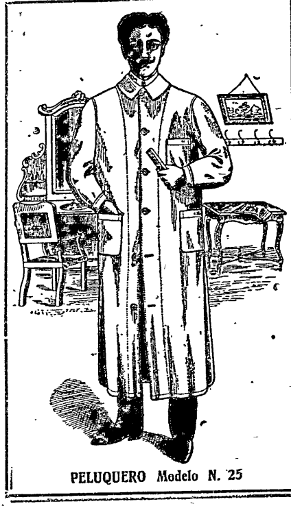
PELUQUERO Modelo N. 25