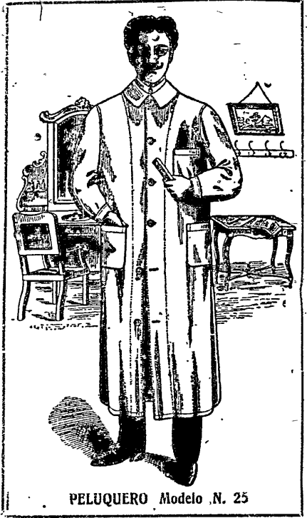
PELUQUERO Modelo N. 25

ENVIOS a cualquier punto de la Republica