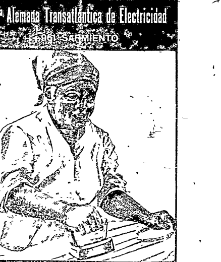
Esta planchadora es la única que plancha y alisa a la vez...

Cigarrillos - Sociales - 33 - a 10 centavos con premios