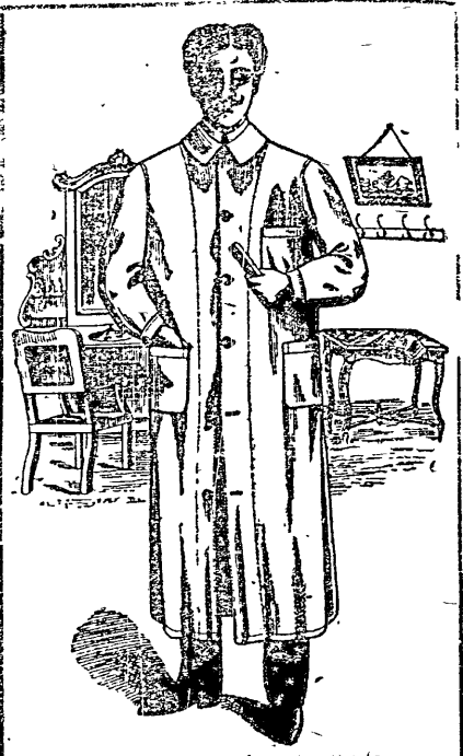
PELUQUERO Modelo N. 23

Pidan catálogo gratis "nuestra ropa no se desdosa" marca registrada