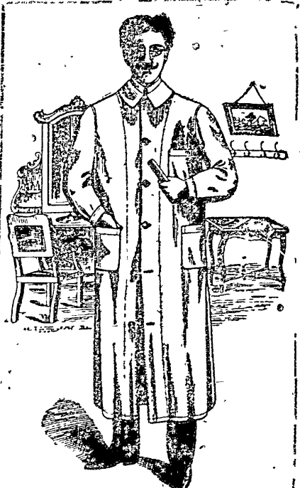
PELUQUERO Modelo N 33

"NUESTRA ROPA NO SE DE ROSA" marca registrada