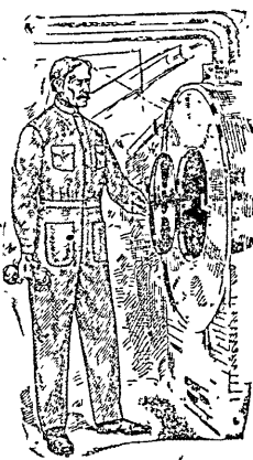
BUZO MECÁNICO — Modelo No. 11