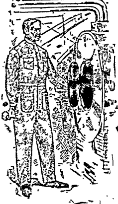
BUZU MECÁNICO — Modelo No. 11