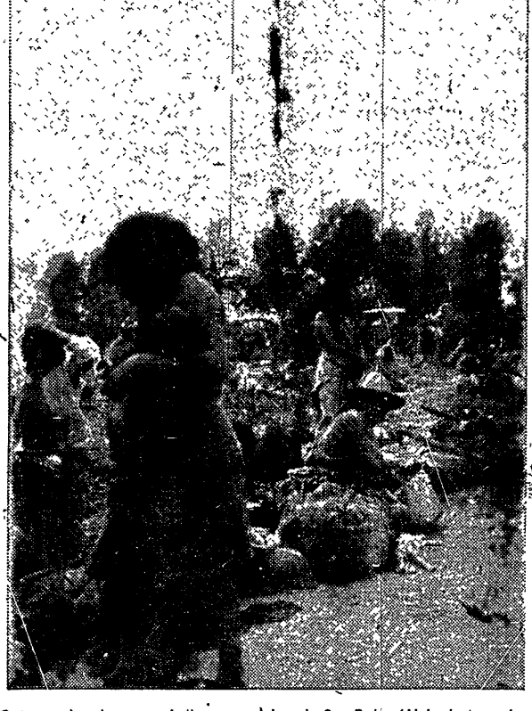
Campamento de peones indios para el ingenio San Pedro (Aljamiento en los alrededores de la estación).