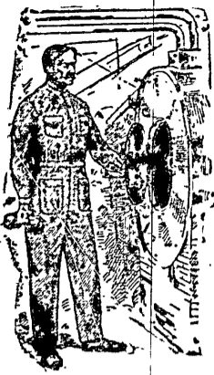
GUZO MECÁNICO — Modelo No. 11