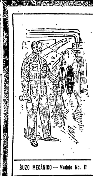
BUZO MECÁNICO — Modelo No. 11

Artículos generales para hombres, jóvenes, niños, niñas y bebés. La casa más importante de América del Sur. La casa que confecciona mejor y más barato en todo el mundo. La que más liberalmente concede créditos. No cobra comisión, interés, ni recargo alguno.