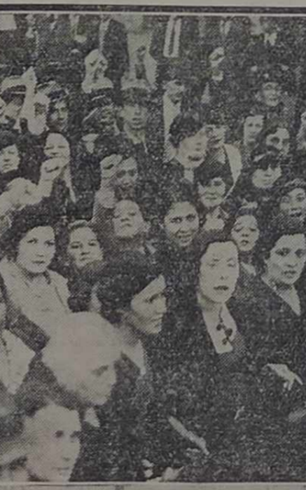
Un grupo de compañeras textiles incorporadas al mitin de los trabajadores

El orador se refirió más adelante al plan de emergencia de la C.G.T. y al programa mínimo de la misma,