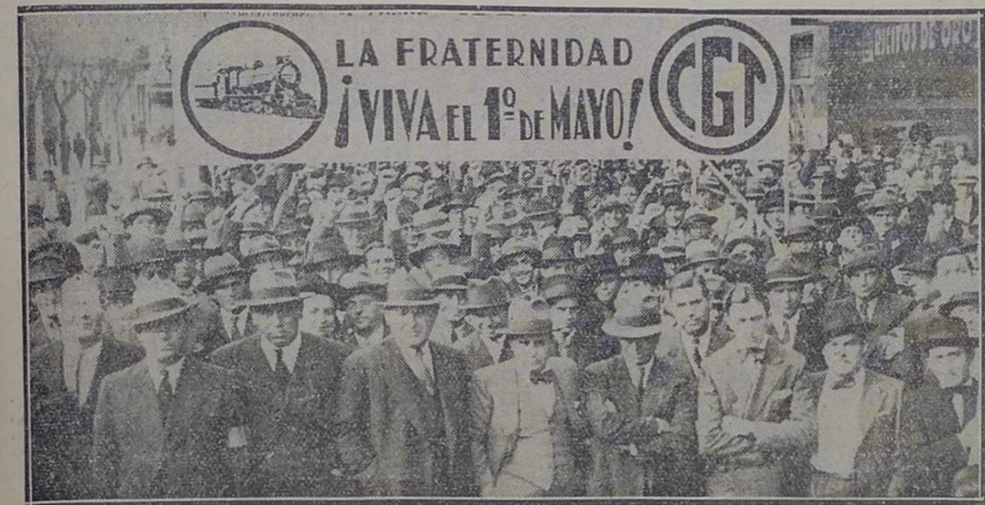
La concentración de obreros ferroviarios al partir desde el local de la Confederación General del Trabajo

Aunque parezca paradójico, la Confederación General del Trabajo, realidad formidable como central obrera, es la esperanza cambiante de los trabajadores; creadora del aliento y firmeza de sus hombres. Su poderío actual emerge de la disciplina sindical, de su base económica y moral, de la unidad de acción; hechos objetivos todos, que revelan la existencia de otra fuerza mucho más grande que reposa en los sentimientos, en la cultura y en la razón que fundamentan y aureolan el pensamiento obrero.