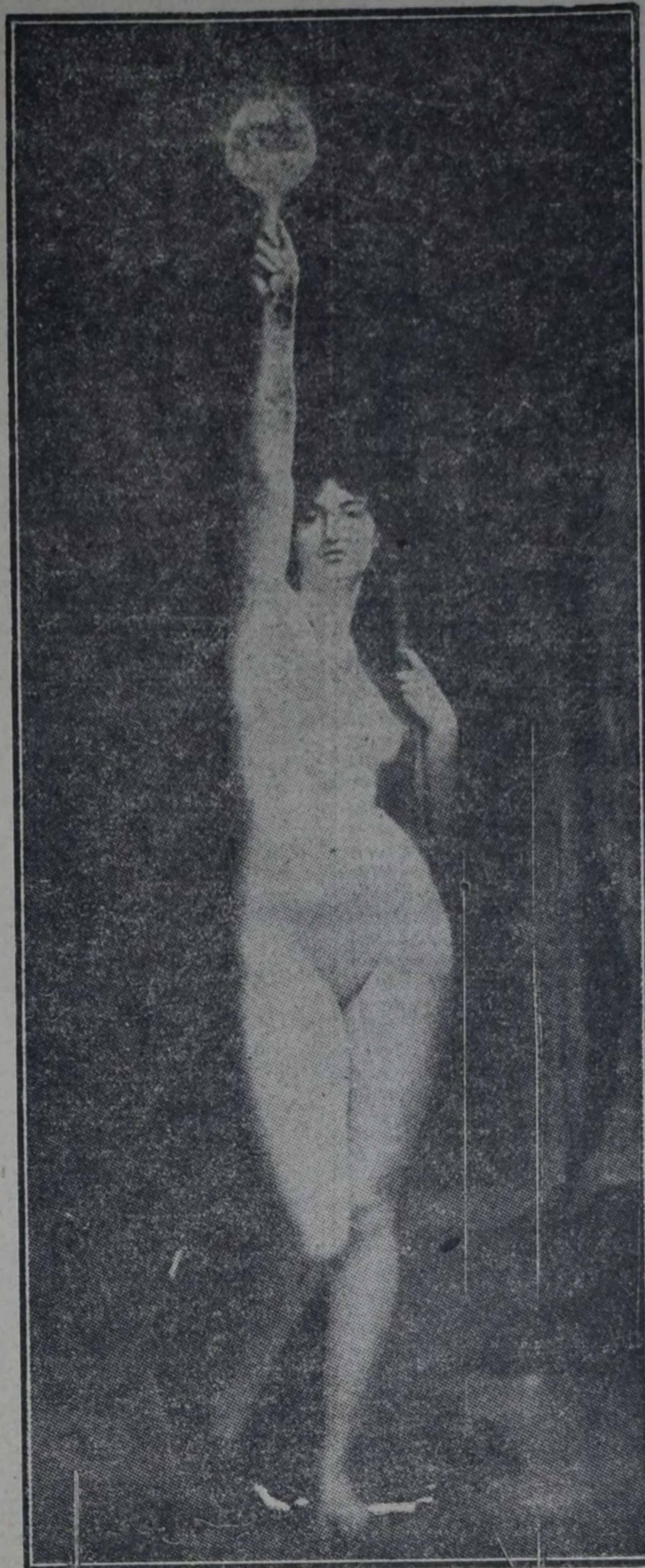
"LA VERDAD", de JULIO LEFEBVRE.

—Un buen plico. —¡Bueno! Pues bueno; eso plico mandó yo, que tengo fondos colocados en el cielo, porque ya sabe usted que ato y desato, que se lo paguen a su espíritu de usted en el otro mundo, en buena moneda de la que corre allí que es la gracia de Dios, la felicidad eterna. A usted lo enterramos con este papellito sobre la barriga, y por el correo de la