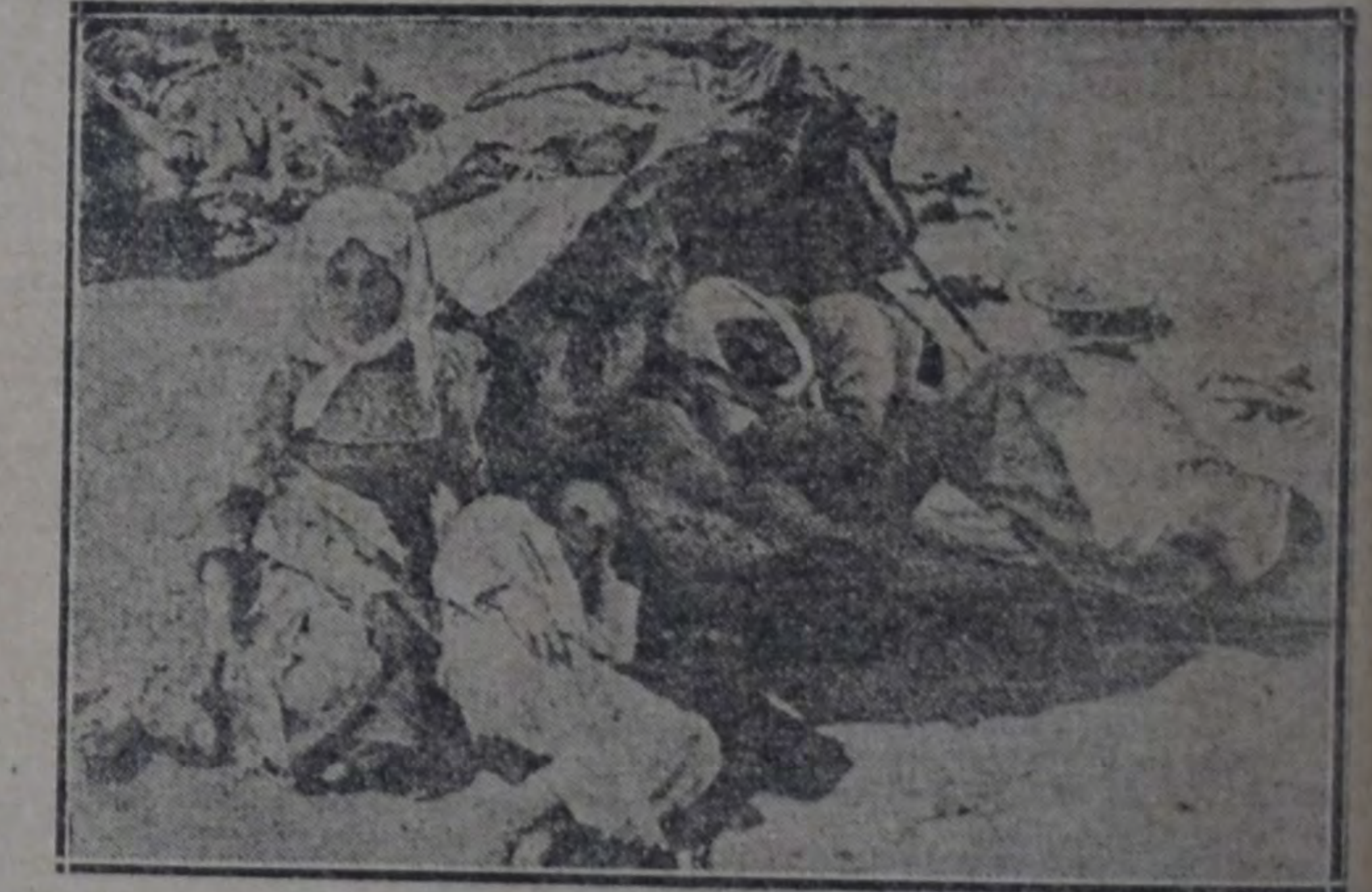
LA ETAPA DOLOROSA