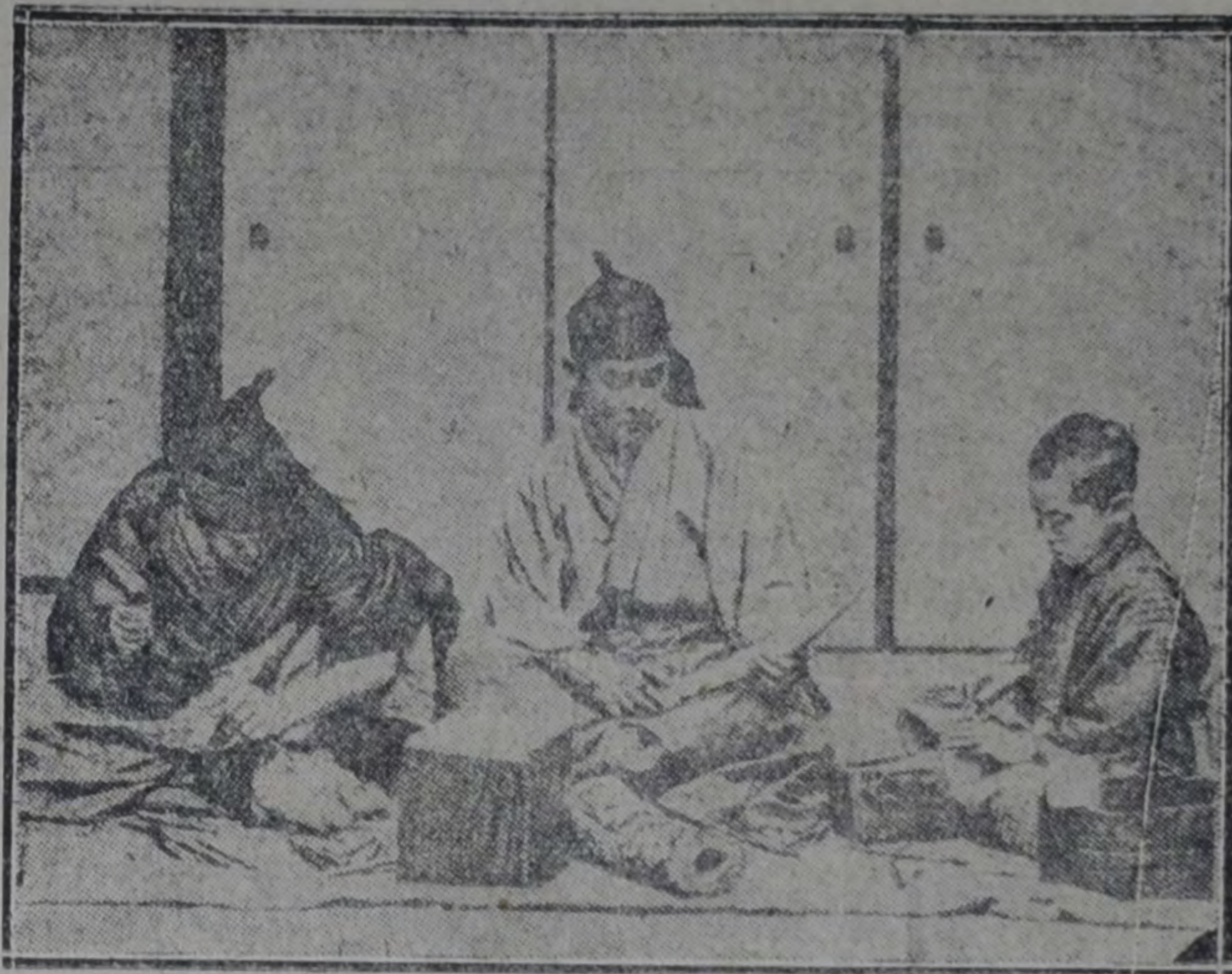
TRABAJADORES EN MARFIL