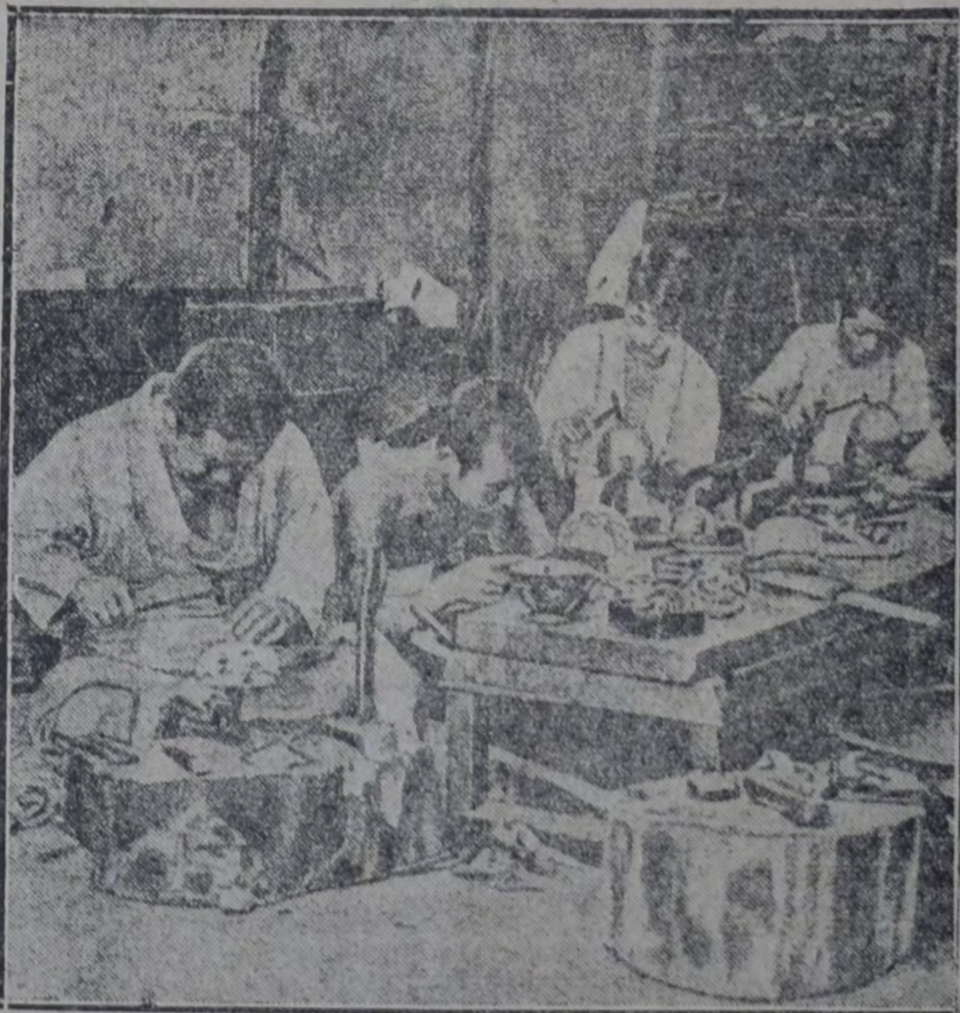
TRABAJADORES EN BRONCE