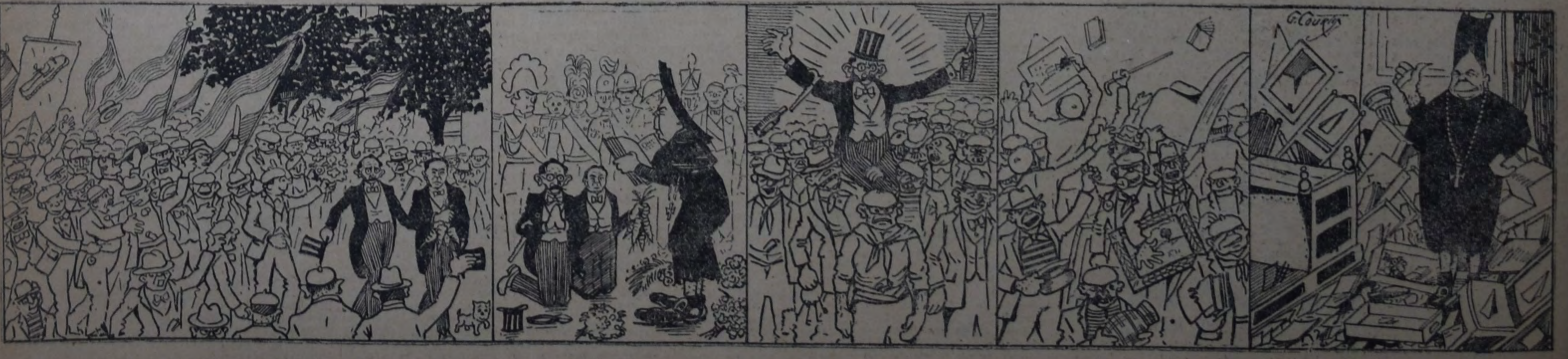
Los presuntos ministros al llegar a la casa de gobierno rodeados de una multitud delirante