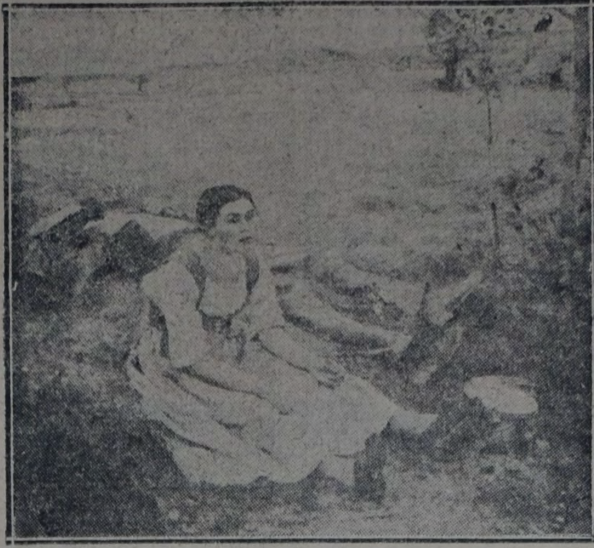
EL DESCANSO, de Julio Bastien Lepage

A decir verdad, sus preferencias fueron cambiando de año en año y su hogar modificóse según los libros que componía. Cada período de su vida aportóle suntuosos alviones. A "Tales" corresponden los recuerdos helénicos, los bustos, los torcos, las estatuillas y las estelas de ambarino mármol; al "Li-Lo rojo", la loza italiana; a "Juana de Arco", las tapicerías del siglo XV; a