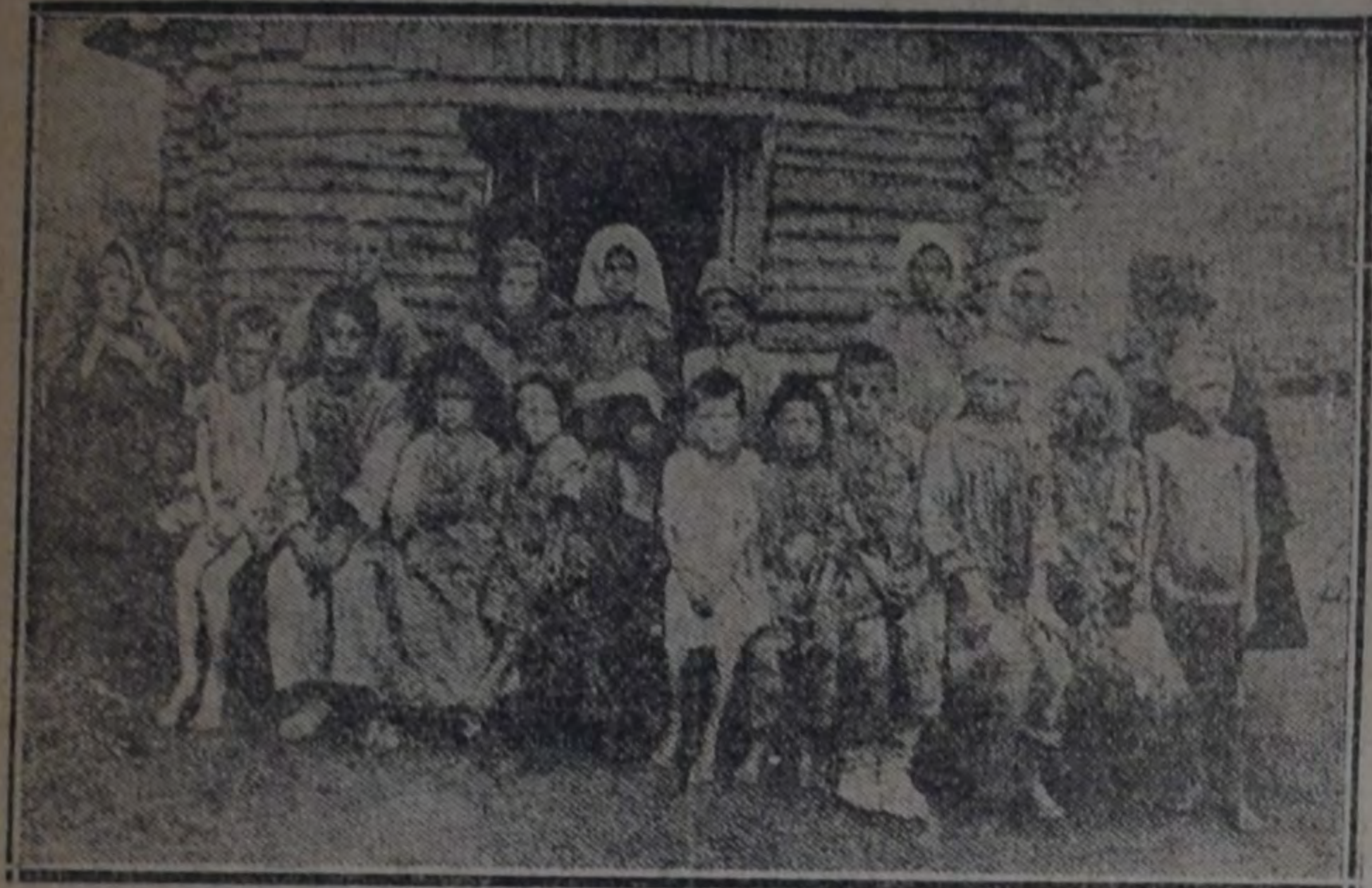
GRUPO DE NIÑOS DE LAS REGIONES DONDE REINA EL HAMBRE

Mr. Cotterell ha traído fotografías de niños alimentados con tierra y con el