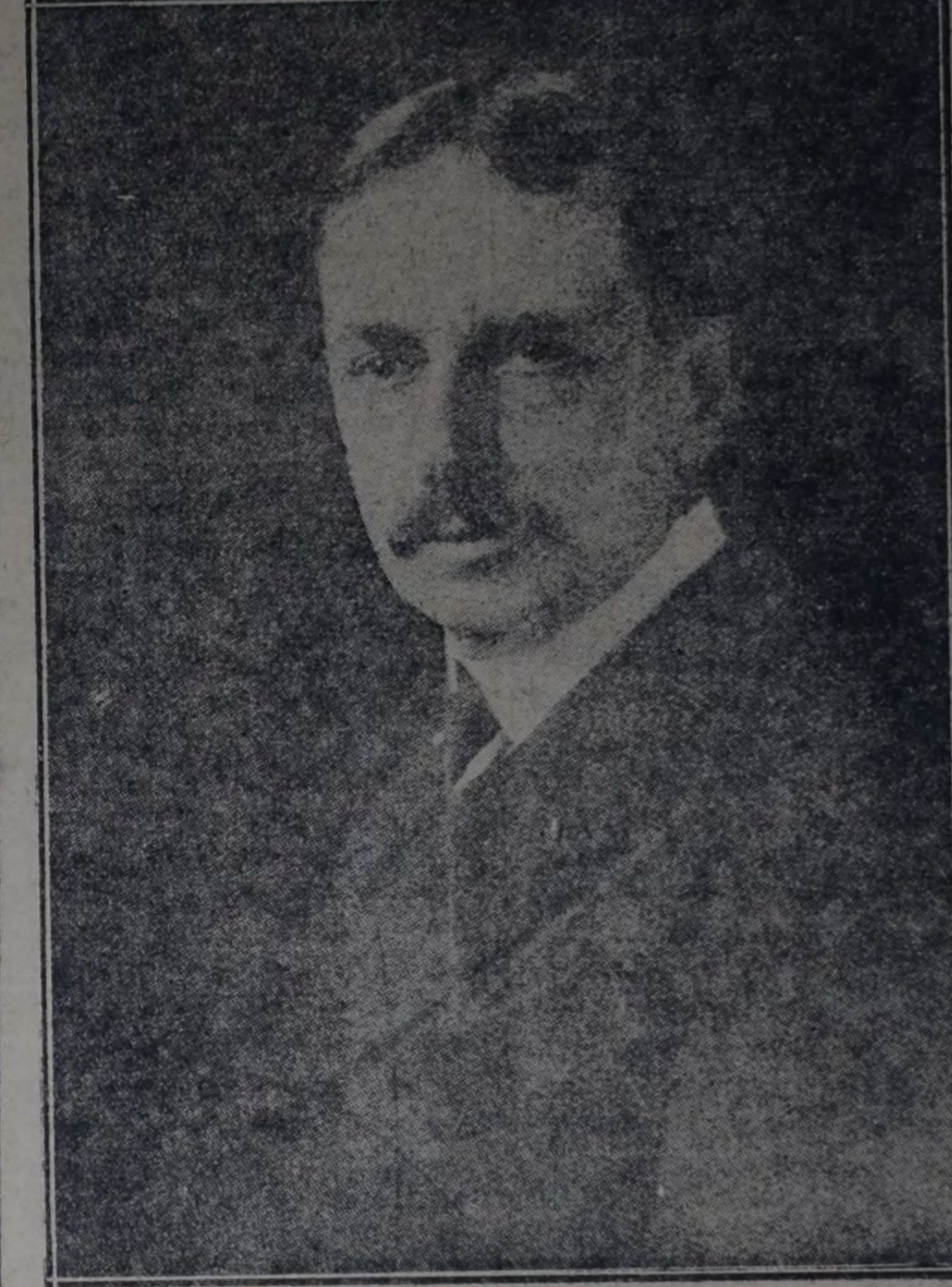
PROFESOR HENRY FAIRFIELD OSBORN

En este capítulo, el profesor Osborn cita en apoyo de estas teorías hechos que parecen sorprendentes. Por ejemplo, en el curso de su evolución un mamífero africano, "cuyo cuerpo tenía las proporciones del lobo y del perro, y que él mismo era descendiente de un antepasado arboreal muy lejano", tomó sucesivamente las apariencias de un pescado y de una anguila, para llegar a ser el "zeuglodon", ballena primitiva provista de dientes. Otro hecho no menos sorprendente es el estrecho parentesco que existe entre la pequeña musaraña africana "upaia" y la gigantesca ballena boreal.