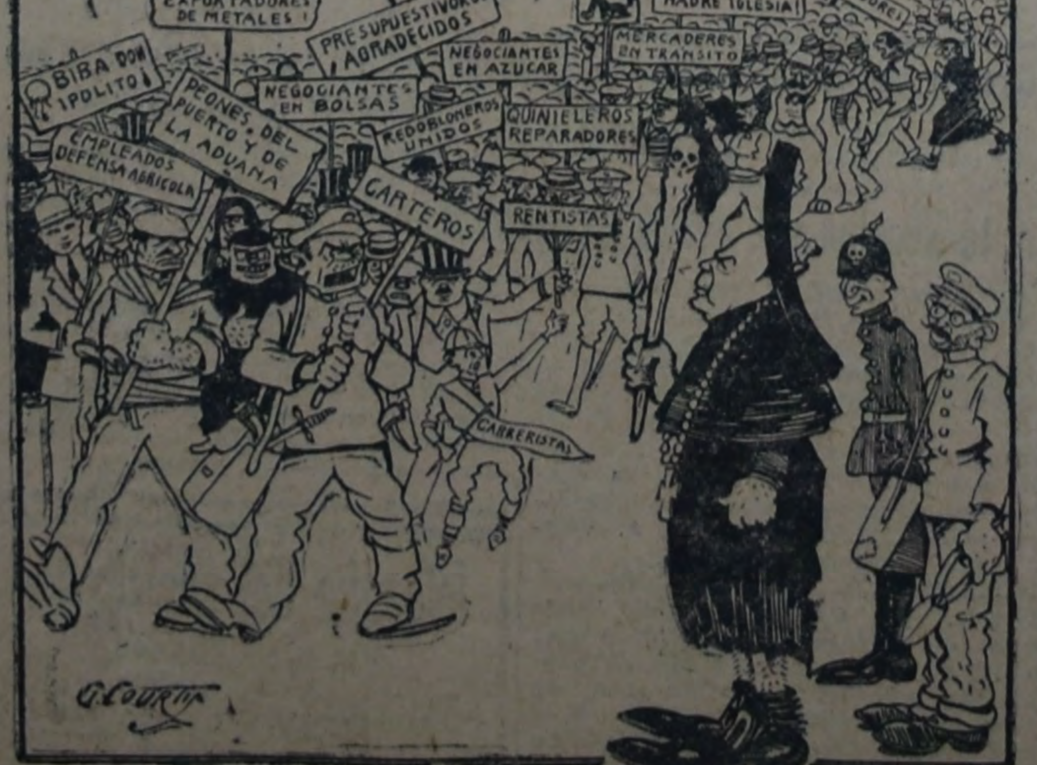
El casi doctor Irigoyen pesa de resaca al electo vencedor.

sin duda, el más preciado de los triunfos.