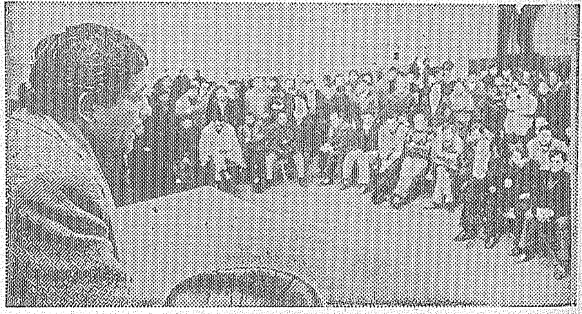
Salamanca preside la histórica reunión

ciables de profundo contenido nacional, popular y cristiano", "supremos objetivos", "supremo mandato", "indiscutible verdad", "minúsculos-grupos-concientizar - trabajadores - ideología - repugnan - nuestra - formación - humanista - cristiana - colisiona frontalmente - postulados - justicia - listas"... Pfff... Hacemos una pausa para que el lector pueda respirar y no se hunda en medio del mar de adjetivos y expresiones gandillocuentes, tan del gusto de los gangsters sindicales. Siguen: "total - absoluta - identificación - conducción - nacional - CGT - acabado - fiel - acatamiento - normas - emanian - organismos - estatutarios", "más - irrestricto - apoyo - candidatura presidencial - Ten. Gral. - J. D. Perón", "repudio - quienes - contramarcha - realidad - hora - histórica - vivimos - lanzado - esfuerzo - decidido - plasmar - revolución - nacional...", etc., etc., etc. Tras esta verborrea doctrinal y re-