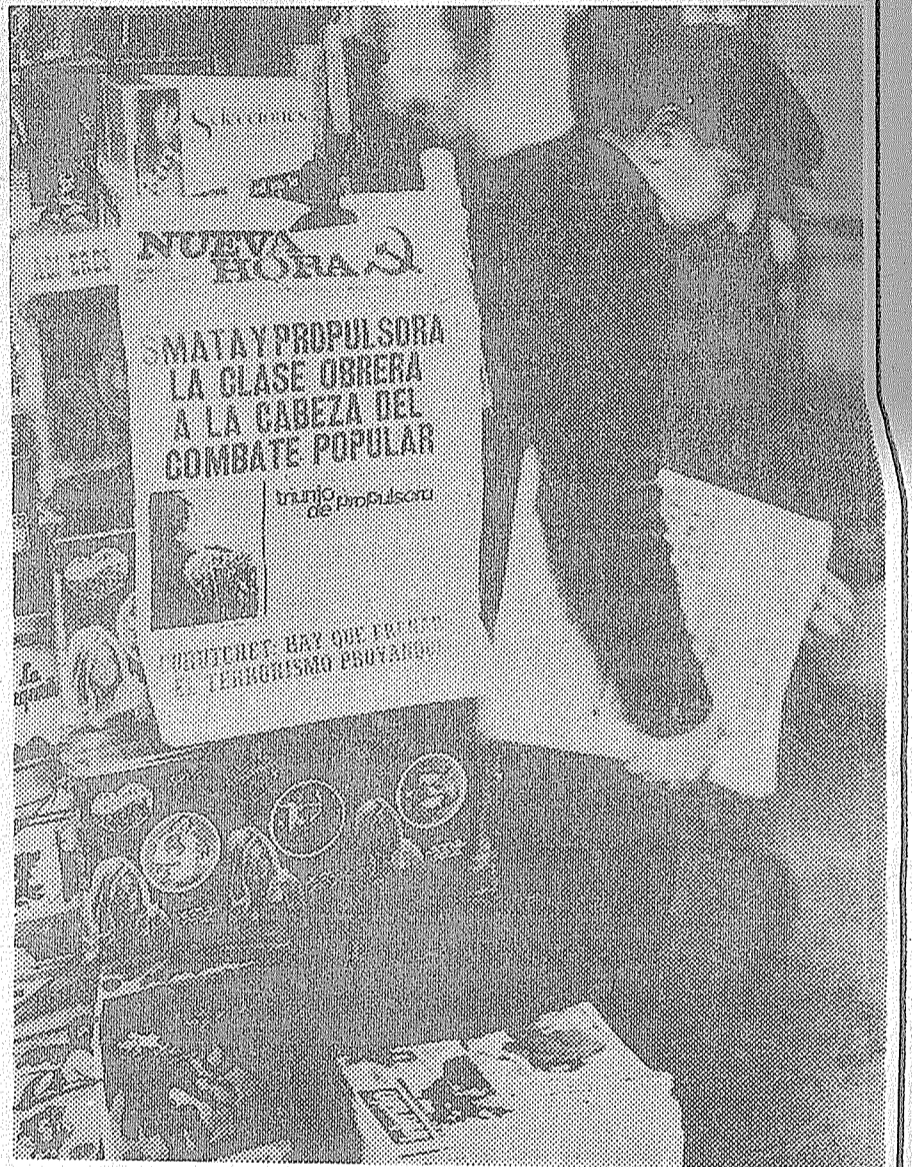
Corrientes: La importancia de trabajar en los quioscos

Es necesario que tanto los compañeros militantes, como así los lectores, mantengan y acrecienten el cobro y la difusión de NUEVA HORA.