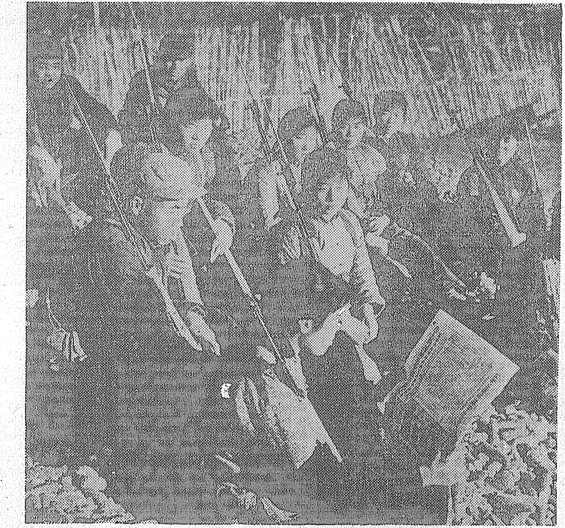
Con el pico en una mano y el fusil en otra, las mujeres de China trabajan por la construcción del socialismo, combinando la labor con el entrenamiento militar.

Al planificar una nueva fábrica, el estado toma en cuenta la proporción de obreras y presta la atención adecuada a construir viviendas, casas cuna, guarderías, escuelas primarias, hospitales y otras instalaciones auxiliares. Por otra parte, los comités vecinales también administran comedores,