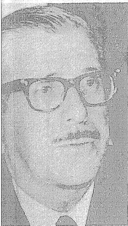
...do de United Steel y Deltec.

La dirección del movimiento peronista y distintos sectores de la burocracia nacional optaron por la "expectativa esperanzada", confinando a la clase obrera y al pueblo a la espera de los acontecimientos.