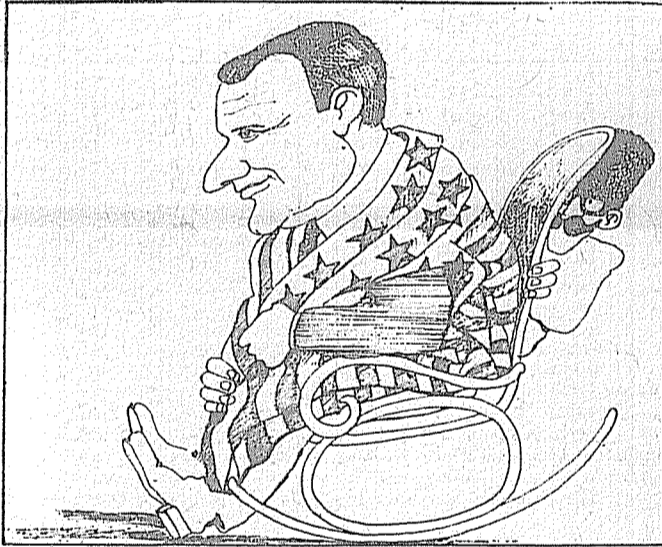
Juan María Bordaberry.

Parece claro que uno de los componentes de esta nueva crisis