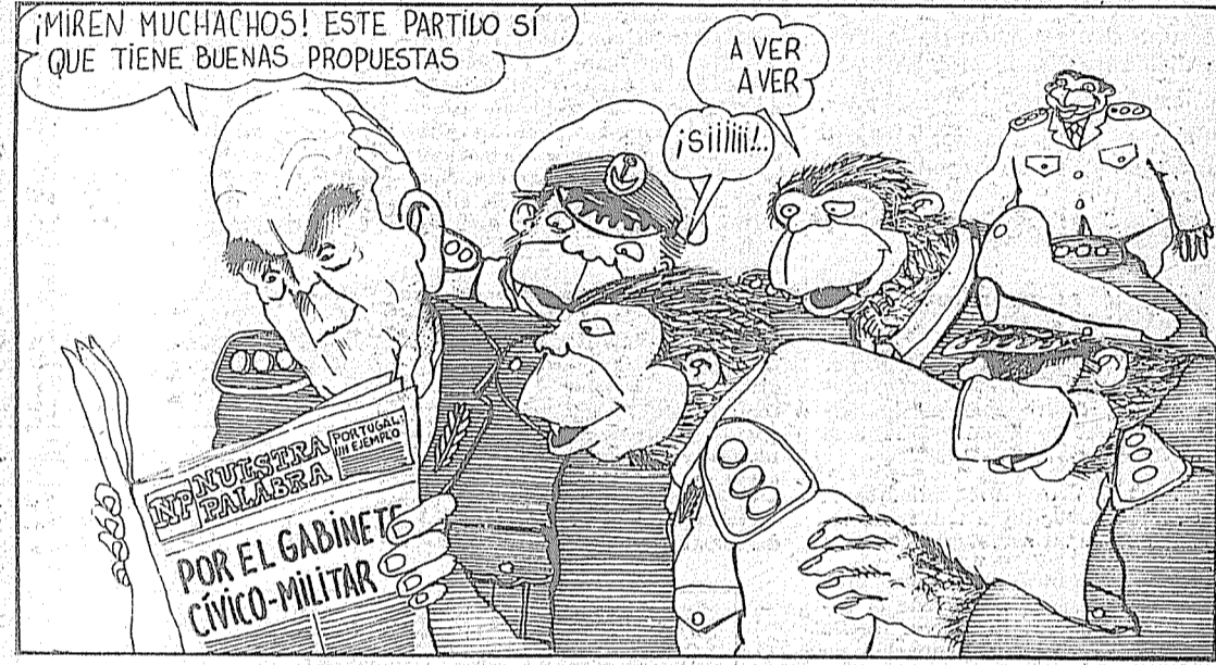
Se dice en círculos de las FF.AA., que la propuesta de gabinete de amplia coalición cívico-militar hecho por el Partido "Comunista" con el propósito de superar la actual crisis política, económica y social, "es uno de los aciertos más importantes de ese partido". (Nuestra Palabra, N° 100, 18-VI-75)

ser sustraídos a la influencia de los golpistas. No es casual que, desbaratadas las maniobras golpistas alrededor de las paritarias, cierta prensa haya cargado las tintas sobre la situación de estos sectores, a los que genéricamente llama "clase media". La Opinión del jueves 19 publicó, por ejemplo, en su primera página, un cínico recuadro titulado "Réquiem para la clase media" e insisten en sus titulares con la idea de que "Se acabó la vida fácil", etc.