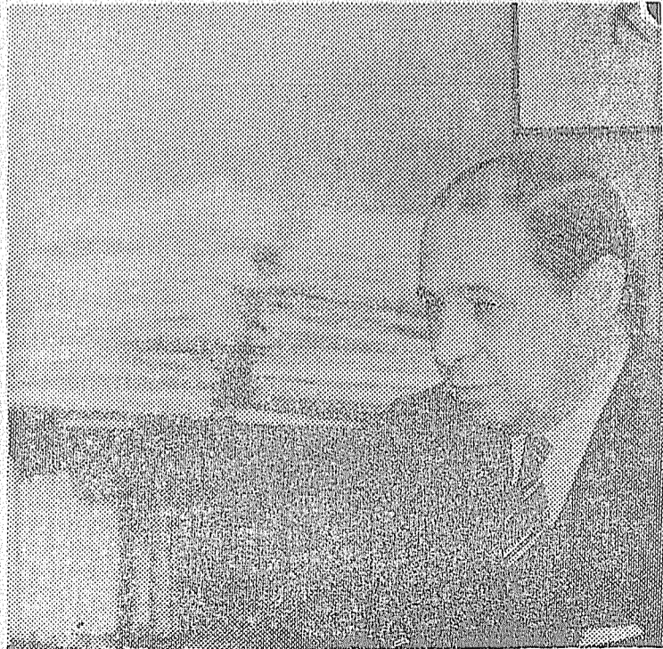
Alvaro Alsogaray. De ministro de Frondizi a publicista de la "Revolución Argentina".

Las fuerzas del radicalismo encabezadas por Balbin hoy se oponen al golpismo. Junto al pueblo peronista, comunistas revolucionarios, radicales, socialistas populares y otros sectores debemos construir una poderosa fuerza antigolpista que impida otro 55 y otro 66.