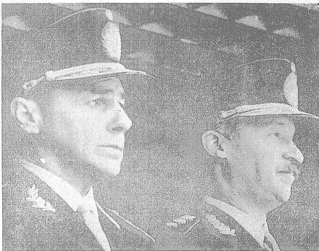
Julio Alsogaray y Onganía. Hoy tienen esperanzas de repetir su "hazaña",

Con el golpe de estado que desplazó al gobierno de Illia, se instaló una dictadura abierta que representaba el gran capital, la oligarquía terrateniente y los monopolios internacionales. El objeto de esta dictadura fue acelerar el proceso de concentración monopolista (en la in-