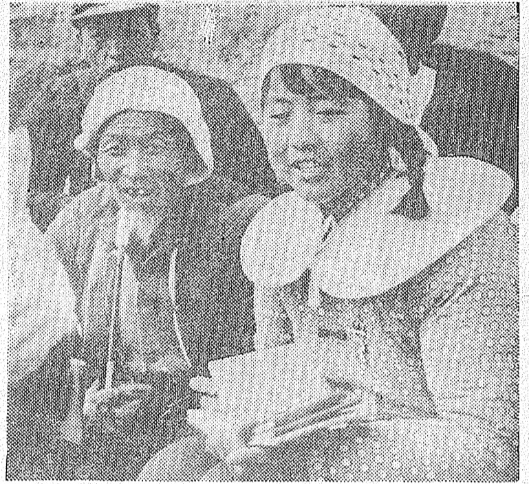
Son las continuadoras de la revolución

Para conquistar la emancipación y encontrar el camino para