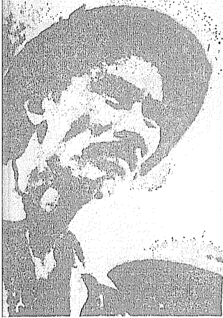
der del pueblo vietnamita

marada Ho Chi Minh dio orden de suspender el levantamiento del pueblo en las provincias de Cao Bang, Bac Can y Lang Son, señalando que las condiciones no estaban aún maduras; y el Buró Permanente del Comité Central criticó severamente el levantamiento armado en Vo Nhai y Dinh Ca el día 11 de noviembre de 1944, como actividades de tipo pequeño-burgués que revelaron prematuramente las fuerzas. Al mismo tiempo, señaló la necesidad de nuevas y más altas formas de lucha para impulsar el movimiento. Dentro de esta línea, el 22 de diciembre de 1944 se organizaba en Cao Bang el Destacamento de Propaganda del Ejército de Liberación de Vietnam, bajo el mando del camarada Vo Nguyen Giap, que junto a las ya existentes unidades del Ejército de Salvación Nacional llevaría adelante las luchas armadas combinadas con las políticas.