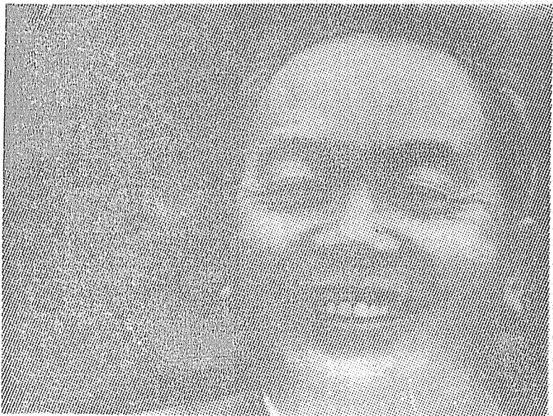
Nguyen Giap, genial estratega militar de las guerras de liberación contra franceses y vanquis