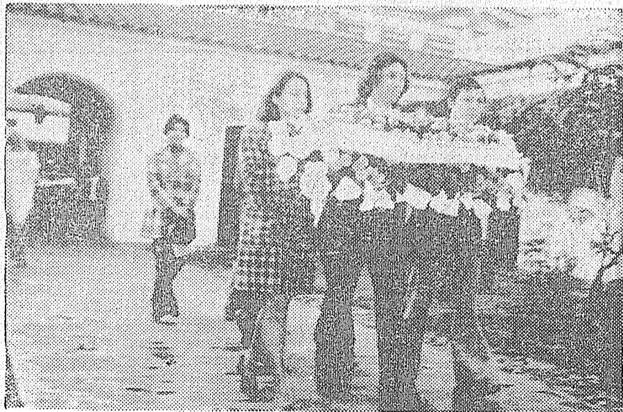
El Comité zonal de Tucumán del PCR depositó el 9 de julio, una ofrenda floral en la histórica casa de la Independencia con el juramento patrio

En los albores de la Independencia en el camino de extirpar la dominación española fue necesario derrotar el intento de dominación de los ingleses. Ello sería decisivo para la gesta emancipadora. Hoy como entonces, en el camino de liberarnos definitivamente de los yanquis debemos derrotar al intento de dominación del imperialismo ruso, a través del golpe de estado en curso. Como los patriotas de mayo, hoy inscribimos en nuestras banderas: "ni amo viejo, ni amo nuevo"; "contra toda dominación extranjera".