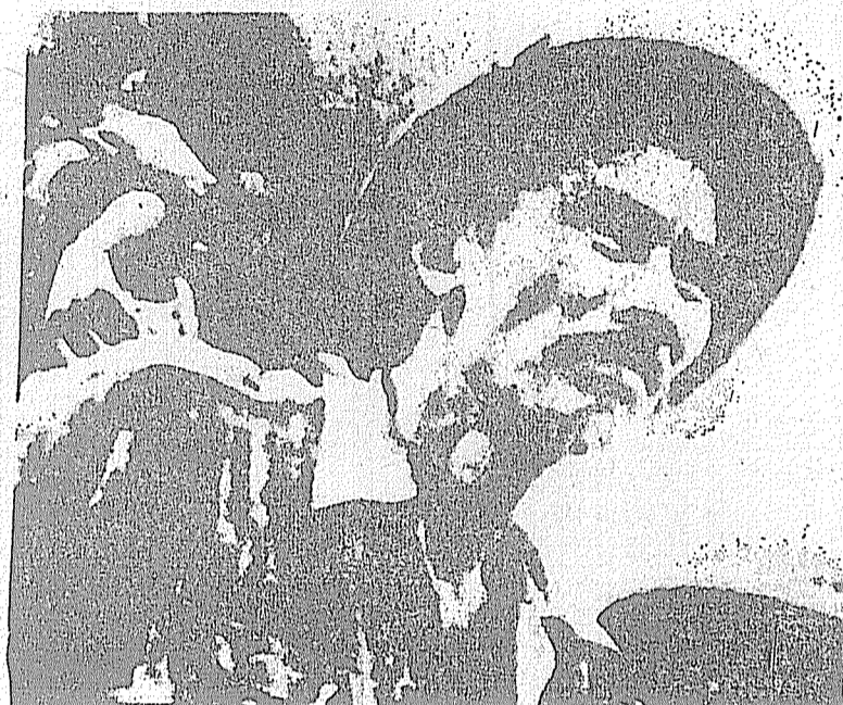
Ho Chi Minh, líder del pueblo vietnamita

Aunque existían contradicciones entre los fascistas japoneses y franceses en Indochina, actuaban sin embargo de pleno acuerdo en la destrucción de la revolución vietnamita, desencadenando salvajes campañas de terrorismo y represión. En aquel tiempo, los países aliados se encontraron en posición defensiva ante el embate de las fuerzas fascistas; sin embargo nuestro partido y el camarada Ho Chi Minh habían previsto de manera muy clara que la Unión Soviética y los países aliados vencerían, que los fascistas japoneses y franceses en Indochina tarde o temprano entrarían en conflicto, y que el pueblo vietnamita lograría la independencia. Esta firme confianza en el futuro luminoso de la nación penetró en cada vietnamita a impulso de las actividades del Frente Viet Minh. El Programa del Viet Minh res-