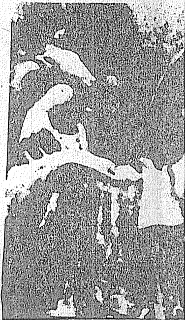
Ho Chi Minh, líder

Aunque existían contradicciones entre los fascistas japoneses y franceses en Indochina, actuaban sin embargo de pleno acuerdo en la destrucción de la revolución vietnamita, desencadenando salvajes campañas de terrorismo y represión. En aquel tiempo, los países aliados se encontraron en posición defensiva ante el embate de las fuerzas fascistas; sin embargo nuestro partido y el camarada Ho Chi Minh habían previsto de manera muy clara que la Unión Soviética y los países aliados vencerían, que los fascistas japoneses y franceses en Indochina tarde o temprano entrarían en conflicto, y que el pueblo vietnamita lograría la independencia. Esta firme confianza en el futuro luminoso de la nación penetró en cada vietnamita a impulso de las actividades del Frente Viet Minh. El Programa del Viet Minh res-