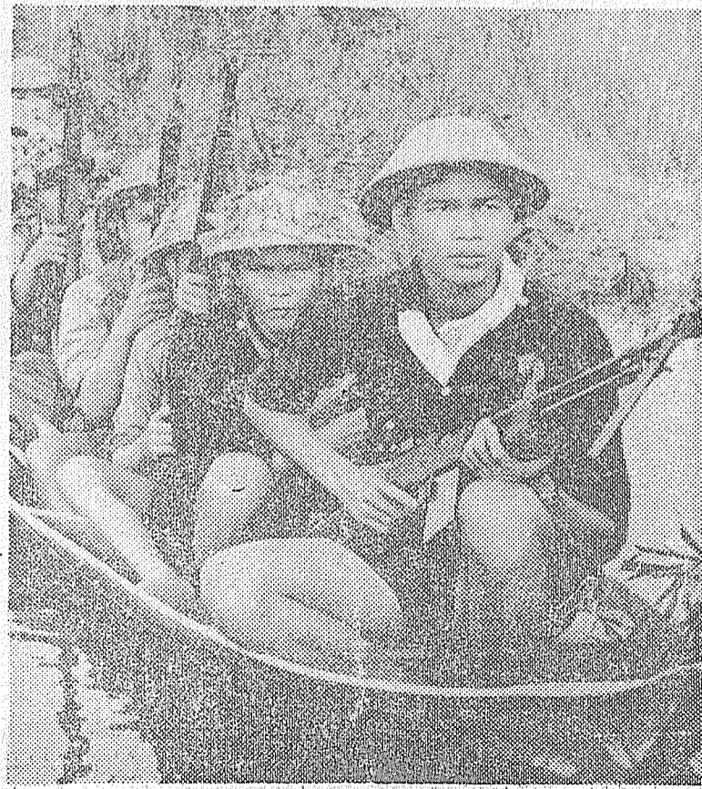
Una larga lucha que culmina con una victoria total