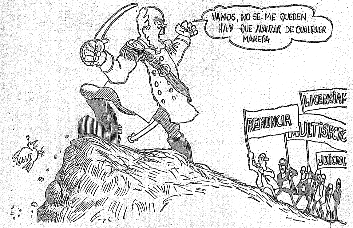
EL GOLPISMO LANUSSISTA APRESURA LOS PREPARATIVOS

Si estos procedimientos "institucionales" fracasan, no habrá más remedio que ejecutar el plan a través de su "reaseguro", como se ha dado en llamar a las Fuerzas Armadas. Paralelamente, si la repulsa popular y la unión y movilización de las fuerzas patrióticas y antigolpistas hacen fracasar estos planes, con este trabajo los prosoviéticos esperan poder armar una poderosa fuerza de "centro-izquierda". Este es un viejo sueño de Gelbard, que hace un año adju-