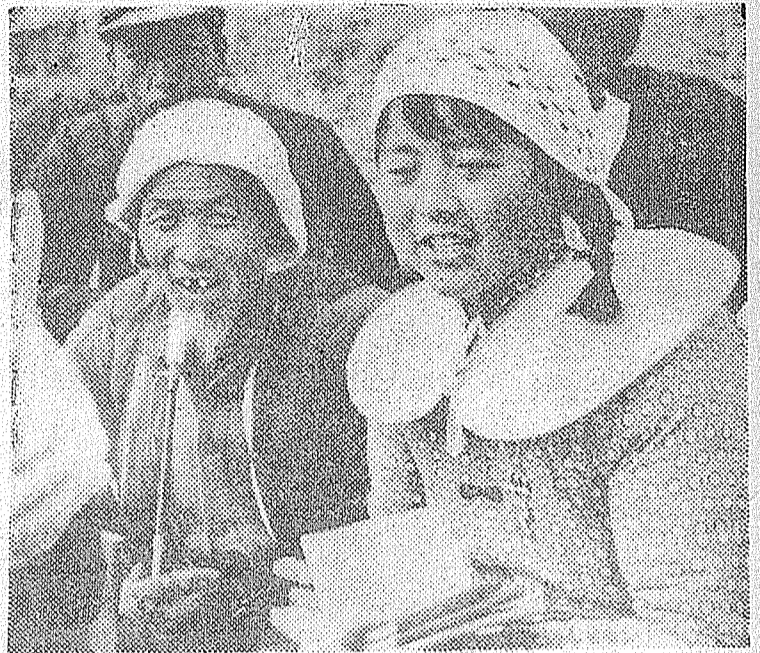
Jóvenes y ancianos profundizan el estudio del marx. leninismo

(2) Alusión al plato tradicional húngaro, el gulash. Al parecer, el cobarde gorrión, que no advierte que "el mundo está siendo puesto al revés" por la lucha de los pueblos, se dejó impresionar por la grosera frase de Nikita Jruschov dirigido a los obreros húngaros, cuando les dijo que comunismo no son sólo ideas, sino un buen plato de gulash. (N. de NH.)