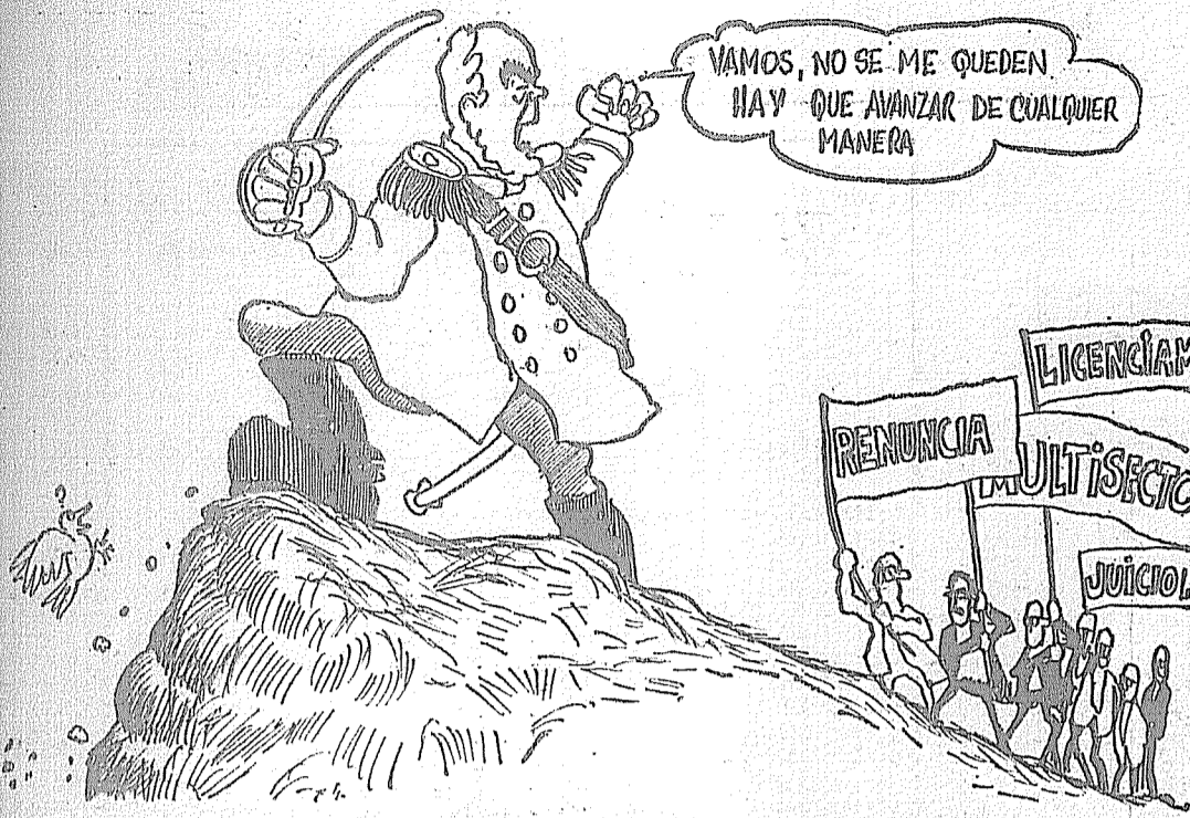
EL GOLPISMO LANUSSISTA APRESURA LOS PREPARATIVOS

dicaba a la misma un posible caudal electoral de tres y medio millones de votos. Los prosoviéticos la suelen llamar "tercera fuerza" y "única opción insitucional". Con el apoyo de dirigentes políticos como Lanusse, Sylvestre Begnis, Alfonsín, De Vedia, Calabró, Cámpora, Alende, esperan desfilcar a Manrique, al peronismo y al radicalismo e incluso se proponen romper las 62 "gordas", como se han dado en llamar a las 62 creadas en la época de Lanusse en función del Gran Acuerdo Nacional.