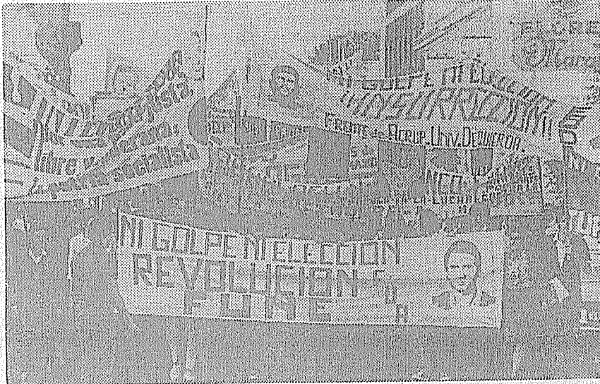
CONMEMORACION DEL ASESINATO DE CABRAL EN CORRIENTES

Es que las explosiones anteriores al golpe Lanusse no podían escapar a una necesidad: voltear a un régimen autoritario que amenazaba institucionalizarse sin dignarse a mirar a los opositores moderados. Ahora hay que voltear a