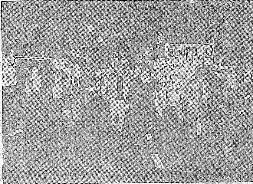
ACTO EN LA CAPITAL EL DIA 28 DE JUNIO CONVOCADO POR LA COORDINADORA NAC. DE AGRUPACIONES CLASISTAS 1º DE MAYO

Para profundizar la crisis y forjar una alternativa política revolucionaria,