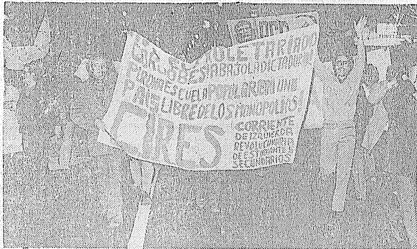
Los estudiantes secundarios, a través de su lucha contra la política educativa de las clases dominantes y su dictadura, se unen a la lucha de la clase obrera y el pueblo todo por la liberación social y nacional.

Hoy, entonces, cada escuela es un campo de lucha donde asumimos las reivindicaciones en el marco de una lucha de clases antagónicas, cada una de las cuales tiene intereses educacionales antagónicos, que a diario entran en fricción generando reivindicaciones que deben ser desarrolladas en este marco y no encerradas en el logro aislado de una conquista, porque entonces se habrá acumulado para la lucha en general o el economismo, pero no para el protagonismo revolucionario.