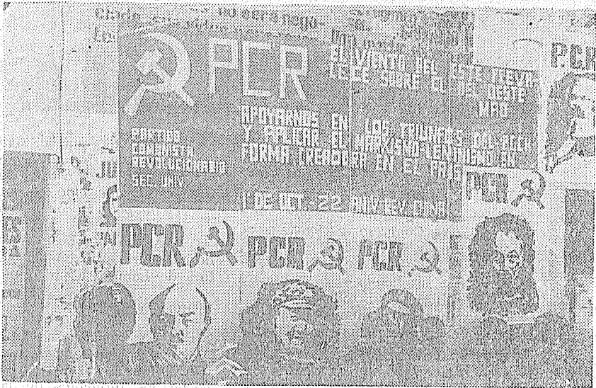
El viernes 1º de octubre, el Sector Universitario de Córdoba de nuestro P.C.R., realizó un acto público en el Comedor Universitario en conmemoración del 22º aniversario de la República Popular China, presidido por las consignas que refleja esta nota gráfica. El acto, como otros que realizara nuestro Partido en diferentes lugares de la República, se inscribe en la lucha común con los camaradas chinos y de otros países por reconstruir el MOVIMIENTO COMUNISTA INTERNACIONAL REVOLUCIONARIO y la tarea que se plantea hoy en la Argentina a nuestro Partido y las demás fuerzas revolucionarias de conducir las luchas de la clase obrera y el pueblo por el camino del Cordobazo, junto a SITRAC-SITRAM, a la ruptura del Gran Acuerdo Nacional montado por la dictadura, avanzando así en el camino de la liberación social y nacional con el proletariado revolucionario encabezando los demás sectores populares.

Para ser gráficos, recordemos el método que utilizaban los torturadores frente a un militante revolucionario preso: mientras varios esbirros se dedican a golpearlo salvajemente y lo amenazan de muerte, aparece otro que simula ser "bueno", aparenta pelearse con los demás, y se ofrece para "salvar" al militante, a cambio, claro, de que éste acepte "colaborar". Ese es, reducido a su esencia, el método que emplea el imperialismo. El brazo izquierdo (Lanusse) hace las veces de "blando", y el derecho (Brasil) de "duro". Según las circunstancias, uno de esos brazos predomina sobre el otro. El "Washington Post" fué al respecto mucho más claro que "La Opinión". Al comentar la nacionalización del cobre chileno, y las amenazas de represalia contra Chile, ese diario publicó la siguiente lección de táctica: "Si Chile está siendo presa de demonios políticos demasiado poderosos para ser dominados por su presidente (sic) él no puede excusar a EE. UU. de perder su sangre fría. El gobierno de Washington debe evitar, en el problema de la na-