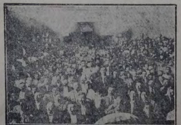
Aspecto de la Sociedad Italiana Cristóforo Colombo, de Godoy Cruz, durante la velada cívica que realizó el Centro local...