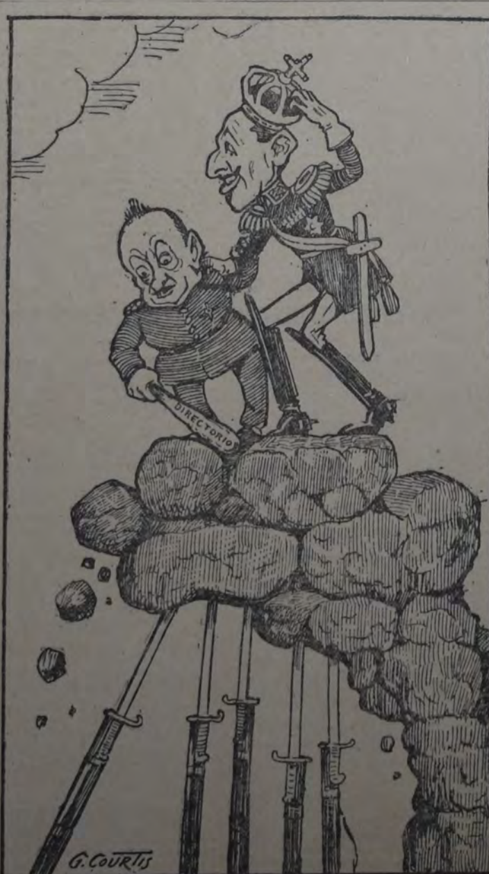
LOS PUNTALES DEL RÉGIMEN DICTATORIAL ESPAÑOL.

Pudo demostrar fácilmente la presión ejercida por los patrones de la industria del motor sobre su personal para hacerle firmar reclamaciones en contra de la abolición. Fues de manifiesto la exagerada absurdidad de algunas afirmaciones respecto a la desocupación que resultaría de la abolición de los derechos. Y como ejemplo de los procedimientos poco honestos empleados contra el proyecto citó el siguiente: el fabricante de motores Morris había declarado que sus establecimientos, directos e indirectamente, daban ocupación a 40.000 hombres, de los cuales muchos quedarían en la calle. Para la sociedad de manufactureros ingleses de motores