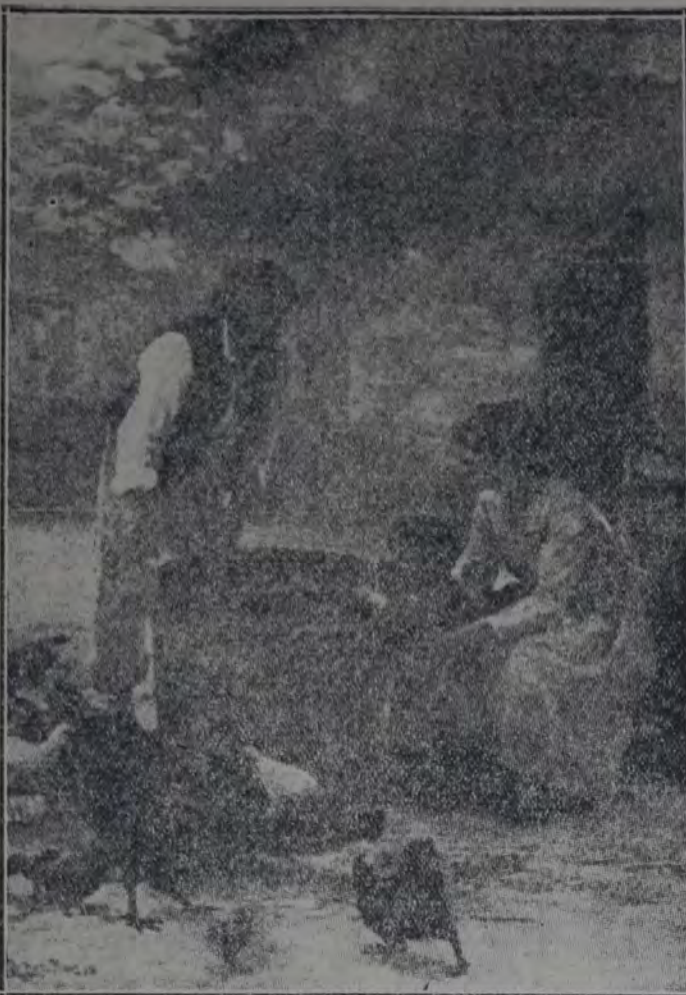
ESCENA DEL CAMPO - Por Debat-Tousan

Porque, muchacho, el esfuerzo de una generación sola, poco puede. Nunca ha bastado, ni para construir una nación; ni para construir una cultura; ni para para construir una simple taza de porcelana perfecta, sin tacha ni reparó.